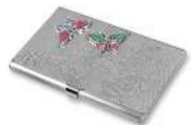
Визитница из хромированной стали

Блокнот также может стать сувениром для бизнесмена. Лучше всего дарить блокнот с обложкой из натуральной кожи. Альтернативой ему может стать органайзер, который содержит не только поле для записей, но и множество карманов и отделений (некоторые на молнии), что улучшает функциональность этого простейшего накопителя информации. В качестве новинки на рынке органайзеров можно назвать авиа-органайзер. Этот аксессуар предназначен для сохранности проездных документов во время туристической поездки, путёвки, страхового полиса и трансферта, а также мелкой валюты для расчётов с персоналом отеля.