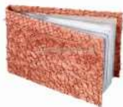
Визитница из кожи рыб

Визитница из разряда «бизнес-сувенир» чаще всего изготавливается из кожи рыб. Как правило, это аксессуар из кожи сёмги. Удобство и долговечность такой визитницы неоспорима. Кроме того, она имеет презентабельный вид, который выказывает в её обладателе безупречный эстетический вкус тонкого ценителя красоты.