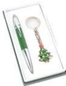
Набор ручки и брелок