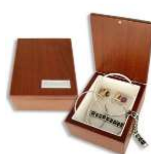
Шкатулка для драгоценностей

Готовясь к Новому году, продумайте всё заранее, чтобы в праздничной суете не тратить лишнее время и лишние средства, а быть во всеоружии и порадовать своих коллег интересным и неожиданным подарком.