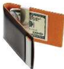
Визитница с зажимом для денег