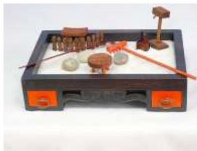
Мини-песочница с грабельками