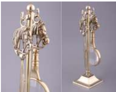
Лупа и канцелярский нож

Второй блок – настольные сувениры, предметы для повседневной офисной работы, креативные штучки для отдыха в обеденный перерыв. Вы мечтаете отправиться на пляжи Монако? Набор с грабельками не только напомнит вам теплое побережье, но и успокоит вашу нервную систему, расслабит перед серьезными переговорами, поднимет настроение. Шары для релаксации восстановят моторику рук, сигара простимулирует работу головного мозга, хромированная точилка заточит ваш карандаш, чтобы с новыми силами приняться за работу.