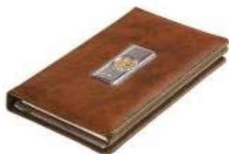
Блокнот из кожи