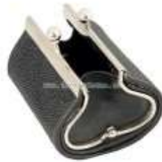
Монетница из кожи ската