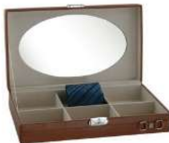
Шкатулка для галстуков