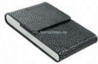
Сигаретница из кожи ската