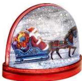
Магнит с движущимся снегом