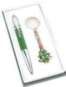
Набор ручки и брелок