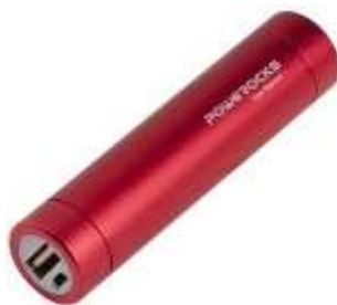
Портативное зарядное устройство