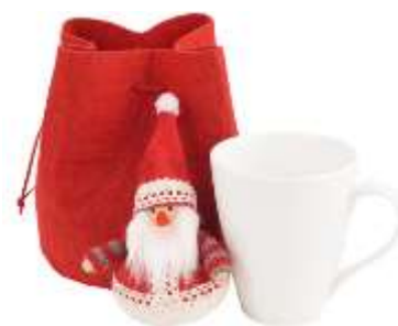
Бокал и мягкая игрушка