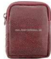
Чехол для фотоаппарата из ящерицы

Второй блок – настольные сувениры, предметы для повседневной офисной работы, креативные штучки для отдыха в обеденный перерыв. Вы мечтаете отправиться на пляжи Монако? Набор с грабельками не только напомнит вам теплое побережье, но и успокоит вашу нервную систему, расслабит перед серьезными переговорами, поднимет настроение. Шары для релаксации восстановят моторику рук, сигара простимулирует работу головного мозга, хромированная точилка заточит ваш карандаш, чтобы с новыми силами приняться за работу.