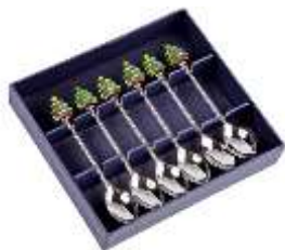
Набор кофейных ложек

Выезжайте на природу с коллегами, проводите конкурсы, состязания, викторины и игры, а чтобы настроение не покидало вас – дарите сувениры, которые всегда напомнят вам те времена, когда вы были в тонусе и работали с удовольствием.