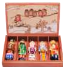
Набор деревянных игрушек на ёлку