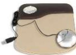
Коврик для мыши