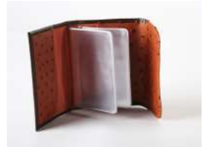
Кредитница женская из кожи страуса