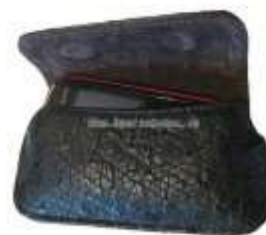
Чехол для телефона