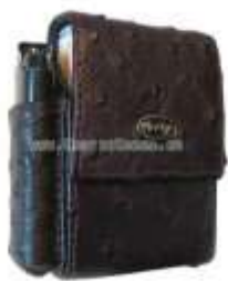
Сигаретница из кожи страуса

Чехол для очков из страуса, как и любое другое изделие из экзотической кожи, порадует подругу, начальника, коллегу, близкого человека, подчеркнув всю гамму ваших чувств, а также обозначив ваш безупречный вкус. Ваш начальник курит? Преподнесите ему сигаретницу из кожи страуса или чехол для зажигалки из змеиной кожи и можете быть уверенными, что он по достоинству оценит ваше расположение. Отличным бизнес-сувениром может стать чехол для мобильного телефона, фотоаппарата, фляга с компасом, зажим для денег. Женскую половину коллектива модно порадовать кредитницами из страусиной кожи, монетницами из ската, ключницами. В любом случае, изделие из кожи – это всегда элегантно, изысканно, стильно.