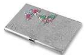
Визитница из кожи рыб