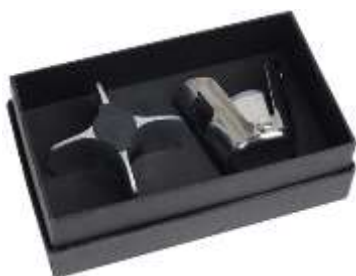
Набор для шампанского