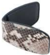
Зажим для денег из питона