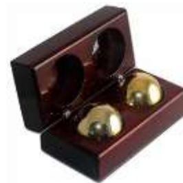
Шары для релаксации

Третий блок – оригинальные сувениры для офиса и дома. С набором «Совершенно секретно» вы соприкоснётесь с криптографией, а дизайнерская визитница ручной работы сохранит ваши личные тайны. Шкатулку для галстуков можно хранить в рабочем шкафу, чтобы дома не возиться с завязыванием узла, галстуки всегда будут под рукой в готовом виде.