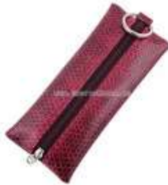
Ключница из змеиной кожи