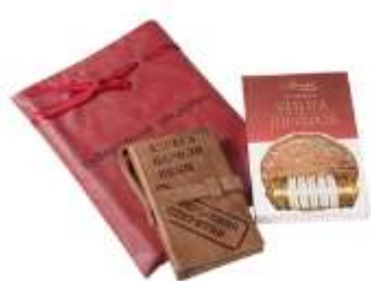
Набор «Совершенно секретно»

Третий блок – оригинальные сувениры для офиса и дома. С набором «Совершенно секретно» вы соприкоснётесь с криптографией, а дизайнерская визитница ручной работы сохранит ваши личные тайны. Шкатулку для галстуков можно хранить в рабочем шкафу, чтобы дома не возиться с завязыванием узла, галстуки всегда будут под рукой в готовом виде.