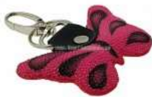
Брелок из кожи ската