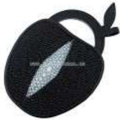
Зеркальце в чехле из кожи ската