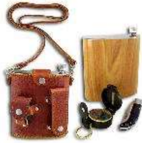
Фляга с компасом