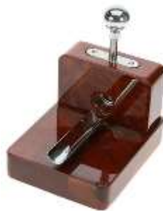
Гильотина для сигар