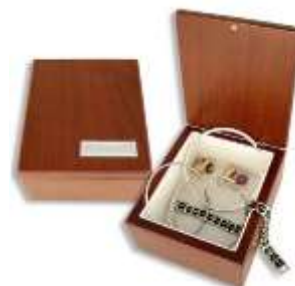
Шкатулка для драгоценностей

Готовясь к Новому году, продумайте всё заранее, чтобы в праздничной суете не тратить лишнее время и лишние средства, а быть во всеоружии и порадовать своих коллег интересным и неожиданным подарком.