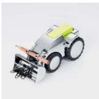
Держатель для скрепок